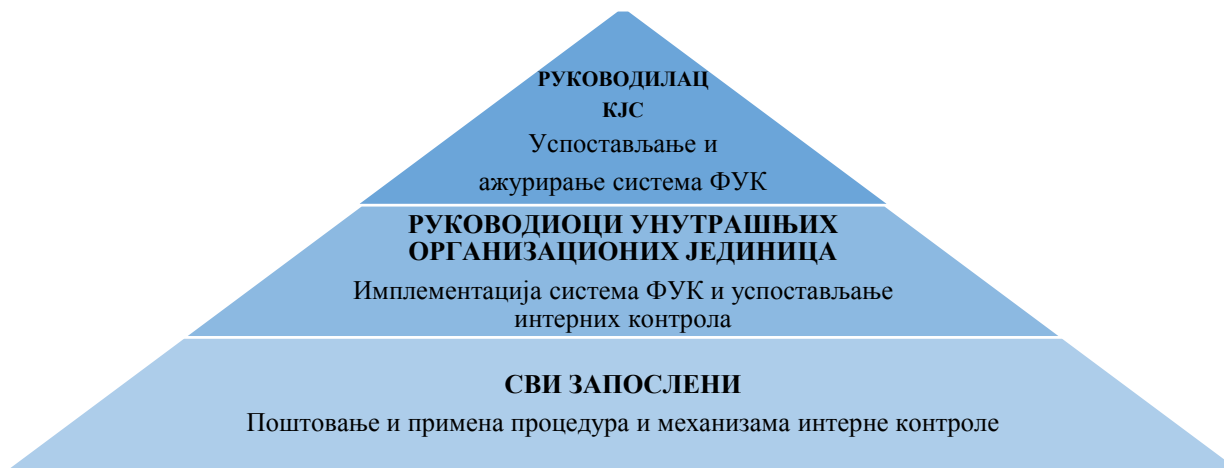
Слика 1. Улоге и одговорности руководства и запослених у имплементацији система ФУК

Одговорност за успостављање и ажурирање система ФУК је на руководиоцу КЈС. Међутим, сви руководиоци унутрашњих организационих јединица КЈС одговорни су руководиоцу КЈС за активности финансијског управљања и контроле које успостављају у организационим јединицама којима руководе. Већи део свакодневних послова везаних за систем контроле делегира се вишим и средњим руководиоцима у организацији, који, пак, одговорност за успостављање конкретнијих политика и процедура интерне контроле додељују запосленима који су одговорни за одређене послове.