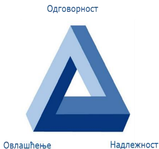
Слика 1. Концепт управљачке одговорности

Управљачка одговорност је концепт на основу ког су руководиоци на свим нивоима одговорни за одлуке и поступке предузете у правцу остваривања циљева корисника јавних средстава. Концепти надлежности, овлашћења и одговорности су међусобно повезани и представљају три стуба управљачке одговорности.